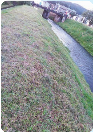
日付川土手下流部