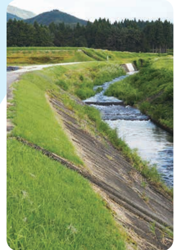
日付川土手上流部