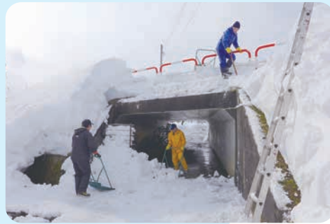
生活道路の雪庇除去